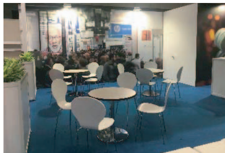
パビリオン内ラウンジ