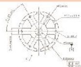
プレス用金型部門【モーターコア】